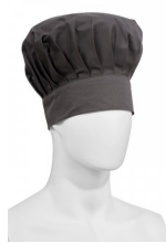
GRIS HIERRO 13067